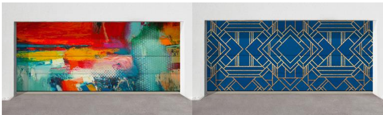
Примеры ворот серии Prestige с индивидуальным принтом