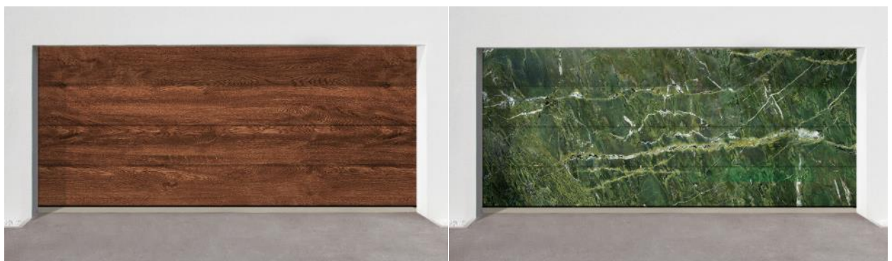
Примеры ворот серии Prestige с текстурами стандартных коллекций

*Дизайнеры ГК «Алютех» работают над постоянным расширением базы стандартных текстур для ворот.